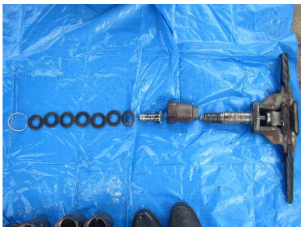
握索装置部品状況