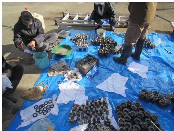
握索装置解体点検状況