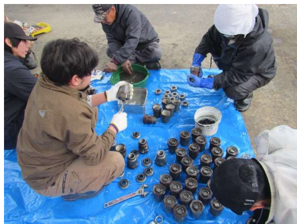
クランプシャフト洗浄状況