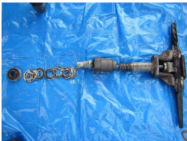
握索装置解体状況